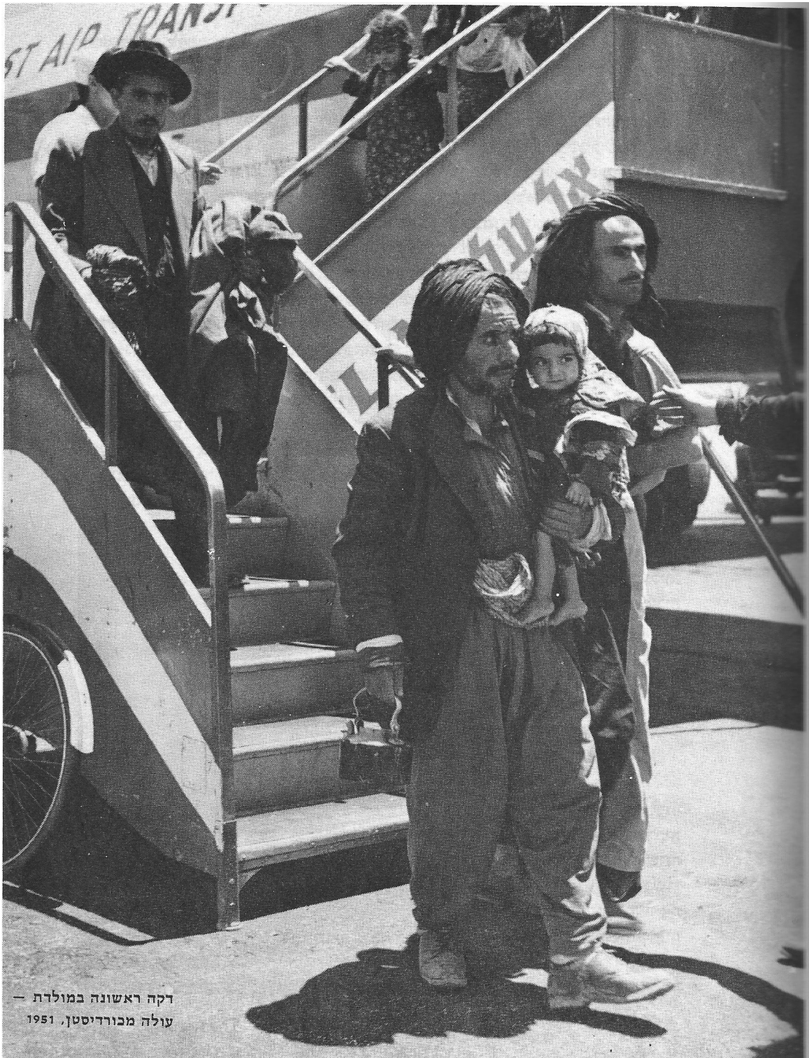
דקה ראשונה במולדת — עולה מכורדיסטן, 1951