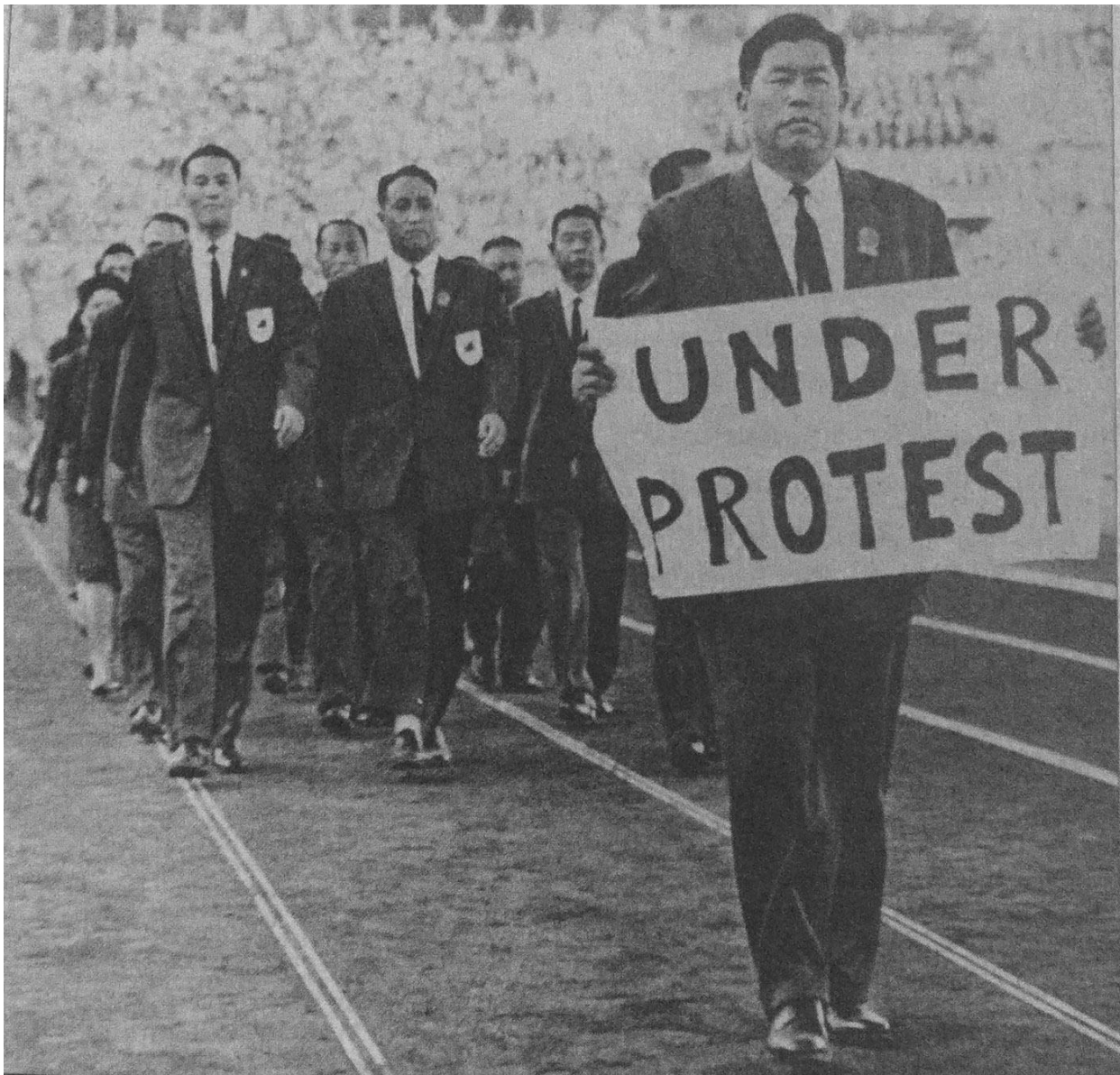
Cerimonia di apertura delle Olimpiadi di Roma del 1960. (2)

della Cina continentale. 166 Il Comitato fu quindi rimosso dalla lista dei comitati membri del CIO: Taiwan avrebbe potuto partecipare ai giochi del '60 solo sotto un altro nome. Un'errata e pigra gestione dell'argomento, fece sì che la delegazione di Taipei partecipasse alle Olimpiadi col nome di "Taiwan", e non di "Repubblica di Cina", come da lei richiesto. Il governo nazionalista decise di partecipare comunque alla manifestazione, ma durante la cerimonia di apertura fece marciare i propri atleti dietro un cartello che recitava "UNDER PROTEST", in segno di disappunto per questa designazione territoriale "ingiusta" e discriminatoria. 167