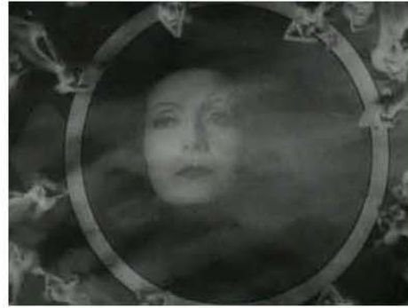
Figura 8. 0:45:07