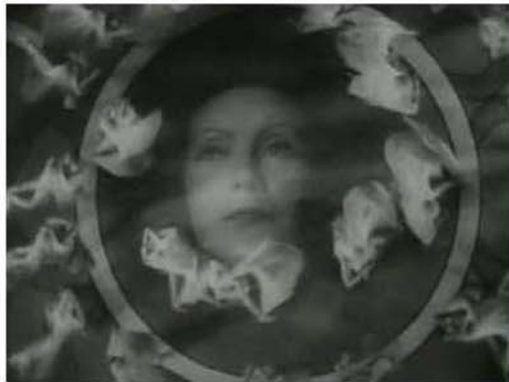
Figura 9. 0:45:08