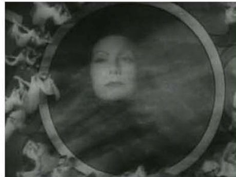
Figura 10. 0:45:10