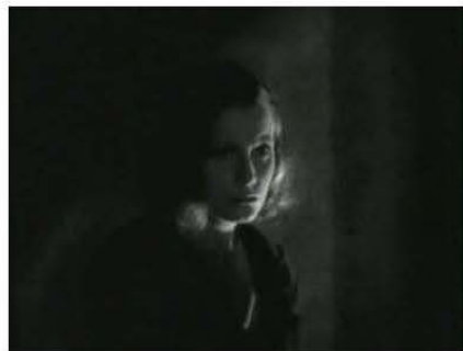
Figura 6. 0:07:37