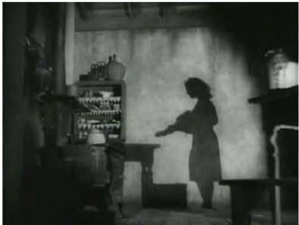
Figura 4. 0:04:21