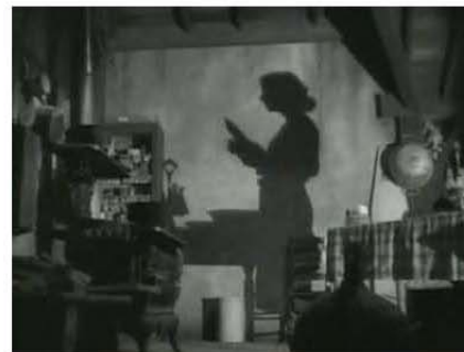
Figura 5. 0:03:30