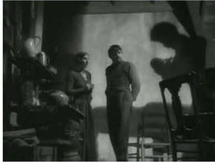
Figura 1. 0:03:54