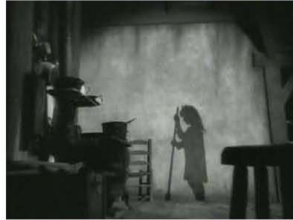
Figura 2. 0:04:02