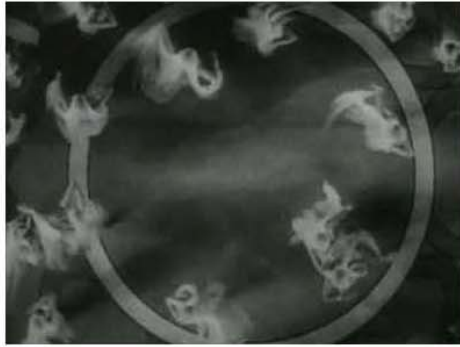
Figura 7. 0:45:06