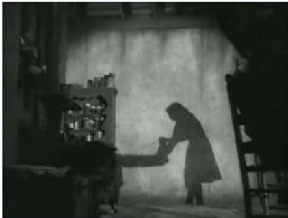
Figura 3. 0:04:16